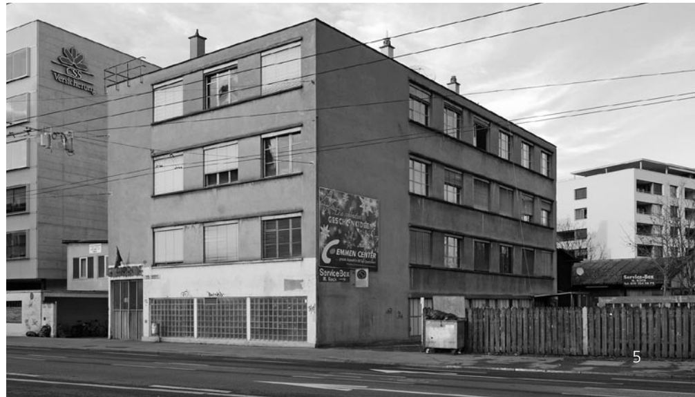
Das Gewerbegebäude heute

Eine Situationsstudie des Autors zeigt eine mögliche Integration und Kompensation der Nutzungseinbusse, die aus dem Erhalt des Gewerbegebäudes resultiert. Die an der Rösslimatte mit dem CSS-Bau (C) realisierte Gebäudezeile (D) kann bis an das Platzen der Rösslimatte (F) fortgeführt werden.