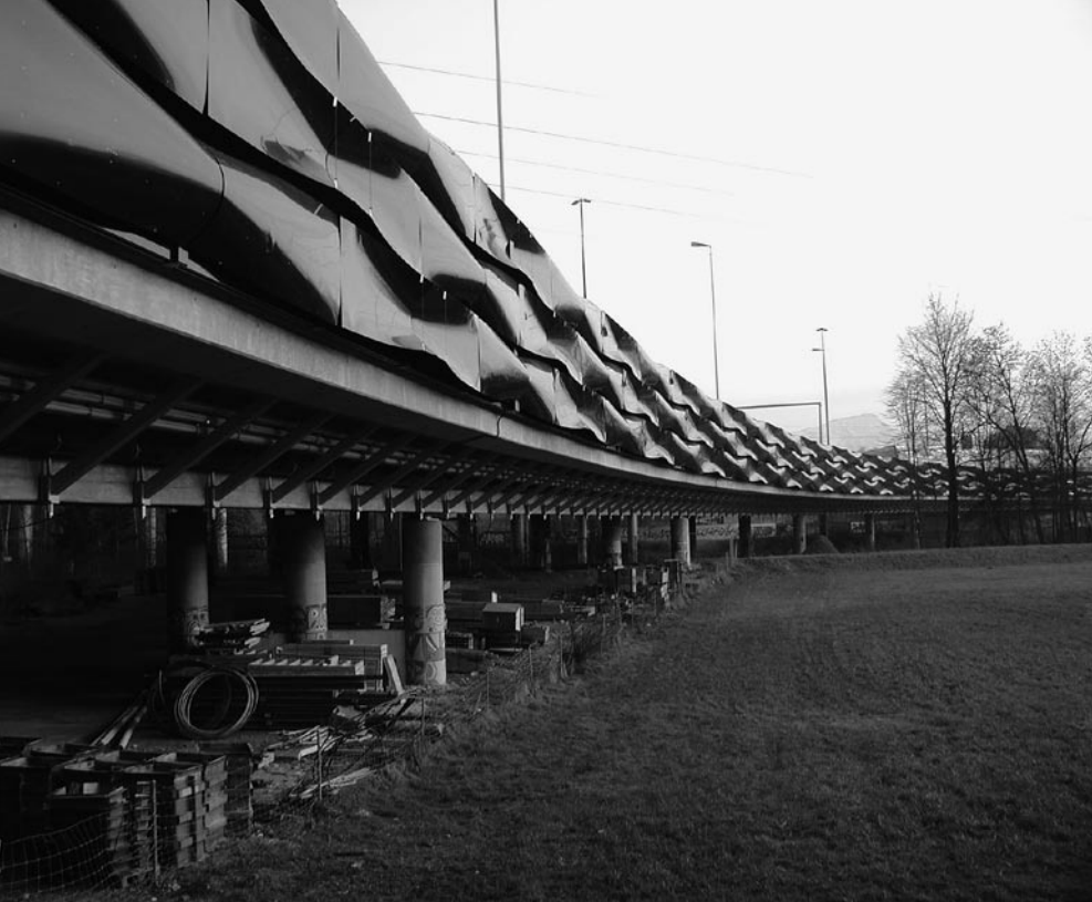
Die neuen Lärmschutzwände wurden auf der Aussenseite mit einer Metallstruktur veredelt.