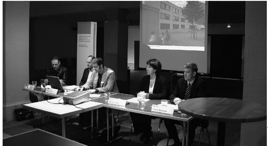
Wakkerpreis Medieninformation in Altdorf

Wichtige Planungsmittel sind Kernzonen- und Quartierrichtpläne, Wettbewerbe und Studienaufträge. Ein gut besetztes Fachgremium beurteilt zudem die Bauvorhaben