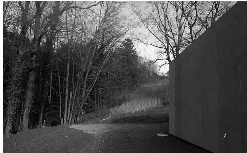
Die Oberflächen für das Reservoir wurden handwerklich aufgewertet.

Durch den Beizug eines Landschaftsarchitekten und eines gestaltenden Architekten konnte eine bessere Eingliederung in das Gelände, eine ruhigere Zufahrtssituation sowie eine Verfeinerung der Fassade erreicht werden. Aus Kostengründen konnten nicht alle gewünschten Auflagen erfüllt werden; die zusätzlichen Aufwendungen jedoch scheinen der gesamten Anlage sehr gut zu tun.